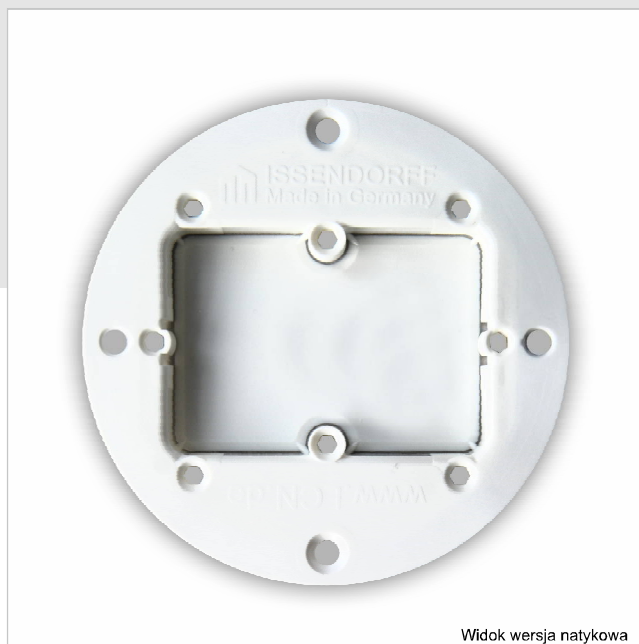
Widok wersja natykowa

W zestawie znajduje się 5 sztuk. Szczegółowe informacje są zawarte w instrukcji instalacji.